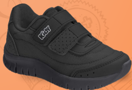
KIDY ULTRA FLEX 445-0008-0007 25 al 32 BR 26 al 33 AL