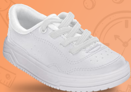
KIDY HAPPY 313-4000-0004 22 al 27 BR 23 al 28 AL