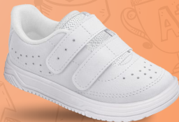
KIDY HAPPY 313-4001-0004 22 al 27 BR 23 al 28 AL