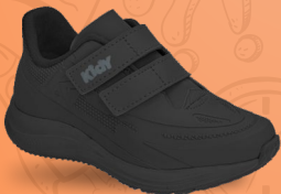
KIDY SUPER CONFORTO RESPI-TEC 438-0021-0007 25 al 34 BR 26 al 35 AL