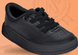
KIDY HAPPY 313-4000-0007 22 al 27 BR 23 al 28 AL