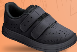
KIDY HAPPY 313-4001-0007 22 al 27 BR 23 al 28 AL